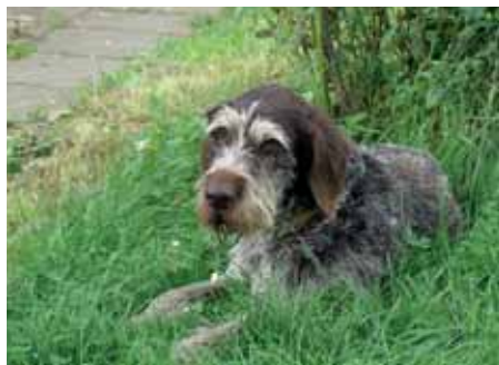
Hrubosrstý český fousek Isa z Těšínských buků

Pátou, značně početnou skupinou loveckých plemen jsou norníci. Jak již z názvu vyplývá, jsou určeni hlavně pro lov zvěře norováním, jejich použití je však daleko širší i na povrchu. Jezevčáci jsou dobrými slídiči, výbornými honiči s vynikající