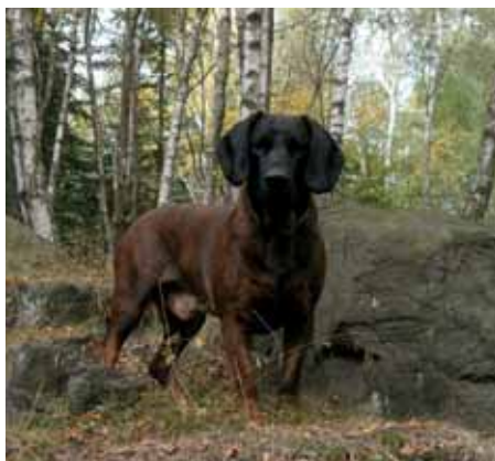
Hanoverský barvář Ar z Líšně

ohař (šedé zbarvení), který v poslední době prochází renesancí obliby u chovatelů. U skupiny ohařů nesmíme zapomenout na hrubosrstého českého fouska, což je původní české plemeno. Mezi ohaře též patří velký a malý münsterlandský ohař a dlouhosrsté varianty ohaře německého a výmarského.