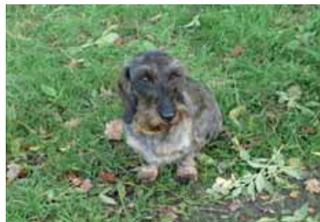
Jezevčík drsnosrstý Uxi z Heřmanova domu