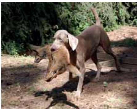
Výmarský ohař Ben Lesní zkoušky – liška

Nejrozšířenějšími plemeny jsou ohaři, jejichž typickou rodovou vlastností je hledání a vystavování zvěře. Vyznačují se prací buď s tzv. vysokým, nebo nízkým nosem, což značí způsob, jakým zvěř navětrí. Většina ohařů se též vyznačuje přirozenou chutí k přinášení ulovené zvěře. Jedinci některých plemen ohařů se též dají s úspěchem vycvičit ke speciální barvářské práci, což je sledování krevních stop postřelené