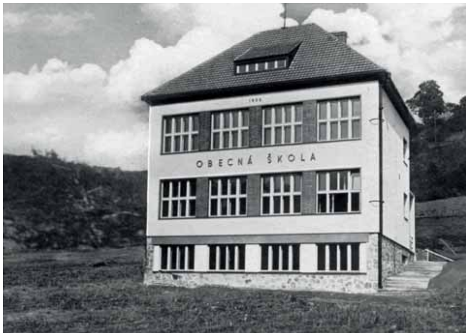
Původní podoba školy po otevření v roce 1936

Obec připravila architektonickou studii rozšíření objektu školy, která řeší především problém s kapacitou mateřské školy,