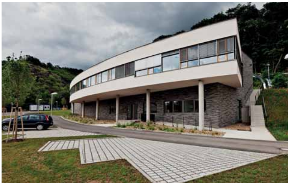
Na moderní budově VaV PET Centra Řež vyrostě třetí nadzemní podlaží se zdravotnickým zázemím pro vyšetřování pacientů.