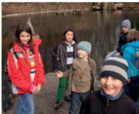
Výlet do Prahy

Užijeme si probouzející se přírodu, zajedeme se podívat na zvířátka do děčínské ZOO a také se budeme připravovat na nadcházející Velikonoční svátky – netradičně si ozdobíme vajíčka a zkusíme i další výtvarné techniky.