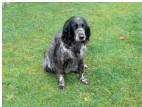
Velký münsterlandský ohař

nehledají, ale slídí po ní a následně ji vypíchnou (vyhánějí) z krytu. Mnozí jedinci se vyznačují hlasitým sledováním stopy. Dělíme je tradičně na lovecké španěly (kokršpaněl, špringršpaněl) a křepeláky (německý křepelák). Z novějších plemen patří do slídičů také labradorský retrív a zlatý retrív, u kterých se oceňují jejich vrozené vlohy k přinášení ulovené zvěře.