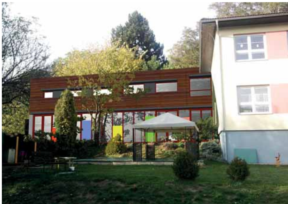
Vizualizace a situační plán přístavby školy