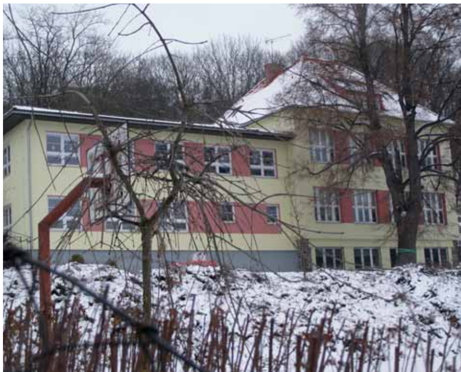
Současná podoba školy

ale nejen ten. Škole chybí plnohodnotná jídelna, funkční provozní zázemí i tělocvična a brzy se nedostatečná kapacita mateřské školy může projevit v nedostatečné kapacitě školy základní. I proto máme v plánu zadat specialistům v oboru demografie vypracování prognózy, která nám narysuje demografický vývoj obce v příštích minimálně 10 až 15 letech, abychom si byli jisti, že kroky, které podnikáme nyní, nezkomplikují situaci v pozdějších letech.