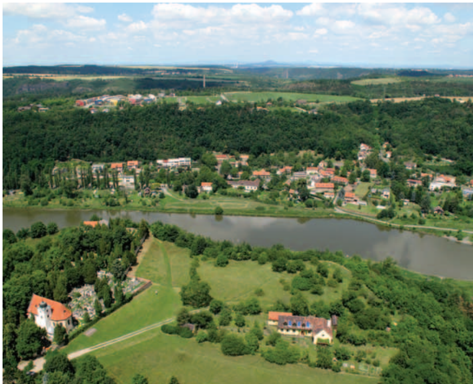
Letecký pohled na Husinec, v popředí Levý Hradec