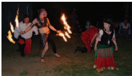
Soubor Fuente Ovejuna

Se setměním vystoupil historický soubor Fuente Ovejuna s představením Přežití rodu, které obsahovalo prvky šermu a ohnivého show. A hned potom se po hromadném odpočítávání spustil jako zlatý hřeb večera krásný a velkolepý ohňostroj, jehož nádheru jsme mohli vnímat