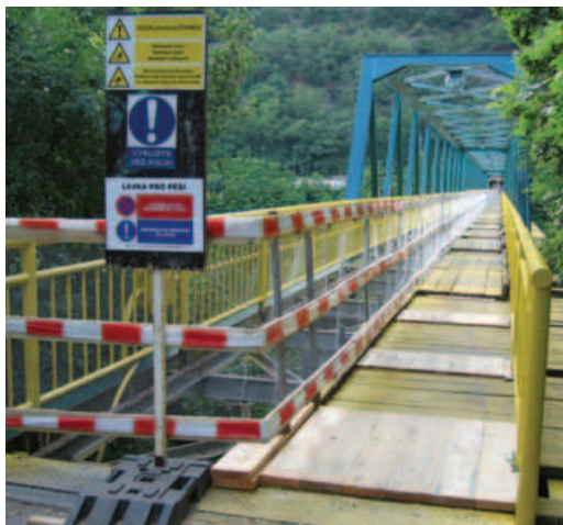
Současný stav lávky