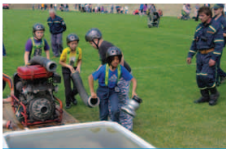
Připojení hadic je dřina

Zároveň s oslavou Dne dětí probíhala i akce připravená Dobrovolným svazkem obcí Údolí Vltavy „Slavnosti na řece“. Řeka v tento den opravdu ožila, loď CARINA připlula i odplula z přístaviště v Řeži zcela přeplněná a na vyhlídkovou