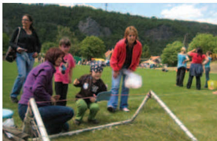
Pirátské soutěže – střelba z „děla“

P řívětivé počasí s občasným slunečkem přilákalo první červnovou sobotu na fotbalové hřiště v Řeži spoustu dětí spolu s jejich rodiči a prarodiči. Letošní ročník byl na pirátské téma a pro děti byl nachystán zábavný program