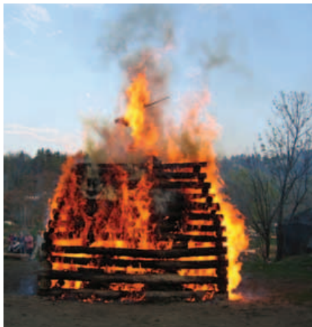
Hranice vzplála i s čarodějnicí ...

Poslední dubnový den byl jako každoročně zasvěcen čarodějnickým rejům.