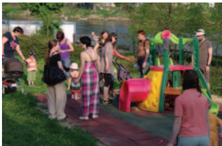
Soutěžní odpoledne na školní zahradě

viděly, některé poprvé a zblízka, kozy, ovce, králíky, prasata, kachny a krocany, tedy zřejmě všechna zvířata, co na domácí dvůr patří, nebo spíše dříve patřila. Atraktivitu výletu pozvedl i ten fakt, že si děti mohly vzít z domova tvrdý chléb, jablka a mrkev a zvířata samy krmit. To byl úplně největší zážitek. Spo-