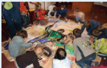
Děti tvoří obraz svatého Václava