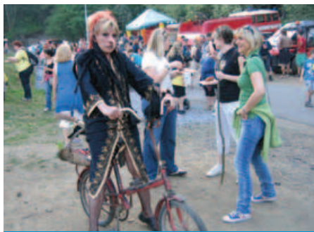
... a druhá se proháněla na kole

Mezitím už bylo vše nachystáno u nedaleké Husinecké skály, a tak po