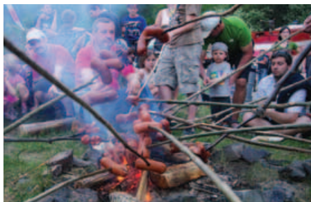
Buřty zavalily malý oheň

hradu a malém kolotoči. K tanci i poslechu hrála živá muzika.