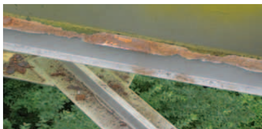
Podélník po očištění v místech oslabení

Nyní oprava pokročila do své druhé fáze, ve které byly zahájeny práce na spodní části konstrukce lávky. Po rozebrání stávající podlahy bylo zjištěno a projektantem