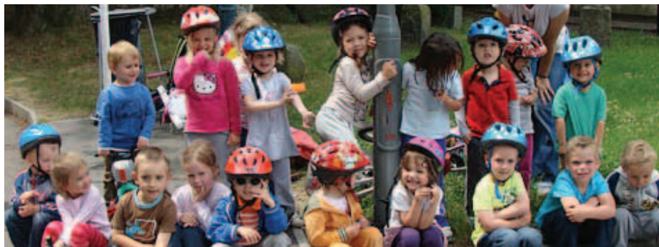
Řežeček na dopravním hřišti

Rodiče malých dětí jsou za otevření Řežečka velmi rádi, částečně tak