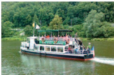
Lod' Carina plně obsazena vyplouvá

na náš nebo protější břeh celkem patnáct vypůjčených plavidel.