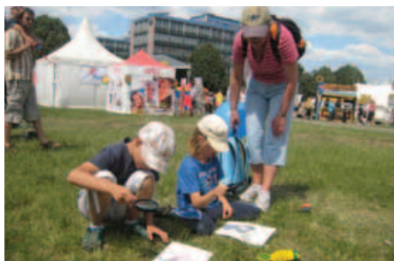
Výlet na Bambiriádu

O všech akcích, které TOM Řež pořádá, se můžete dozvědět na webových strán-