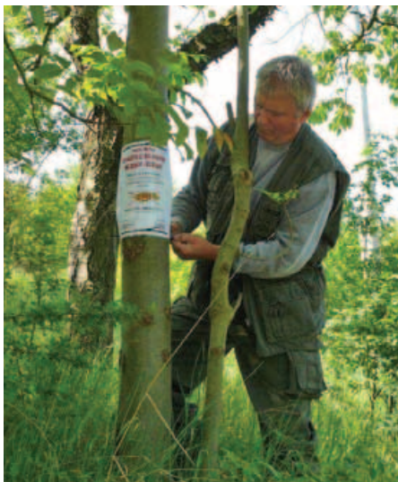
Nenechte volně pobíhat psy v honitbě, žádá leták majitele psů

Koncem července a počátkem srpna se díky sklizni obilovin změní jinak úživná