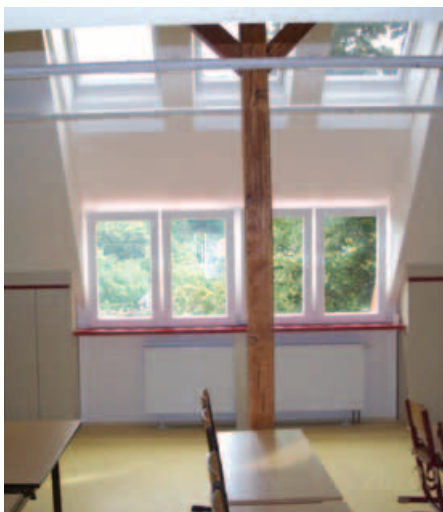
Pohled do podkrovní učebny

Nová třída je příjemným, světlým a účelně zařízeným prostorem, který mimo jiné skýtá i nádherný výhled do údolí Vltavy. V rámci vestavby vznikla v podkroví také útulná a praktická keramická dílna.