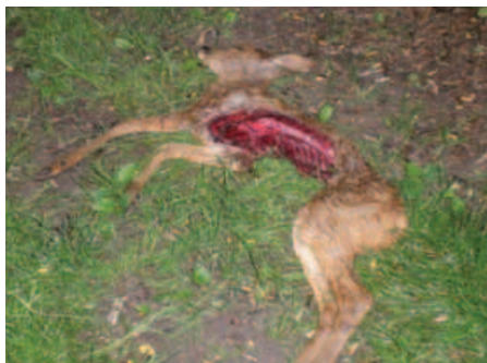
Letošní srnče nemělo proti psu šanci

Závěrem si dovoluji požádat všechny, kterým záleží na ukončení dalšího poškozování zemědělské krajiny naší země, aby navštívili www.zemedelska-krajina.cz .