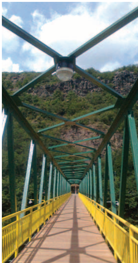
Nová podlaha lávky z tropického dřeva

Všem uživatelům lávky děkuji za trpělivost a toleranci, kterých bylo potřeba při překonávání nepohodlí a překážek souvisejících s probíhajícími pracemi na lávce.