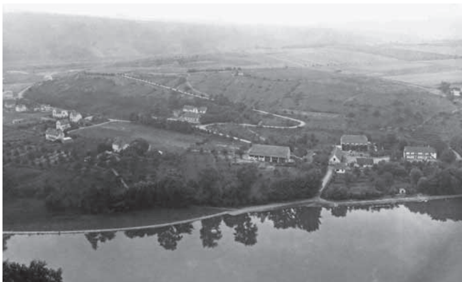
Usedlost čp. 2 – sídlo „Komuny“ je na dobové fotografii Řeže druhá zprava

anarchokomunismus kombinovat představy o komunismu (společnost, ve které si lidé vzájemně poskytují a zajišťují bezplatně veškeré služby a zároveň kolektivně vlastní veškerý majetek) a anarchismu (požadavek po společnosti, kde budou všichni svobodní, a nikdo nebude panovat nad nikým). Teoretik anarchokomunismu Kropotkin se totiž obával, že samotný komunismus bez anarchistických idejí svobody by se zvrhl v diktaturu. Po zkušenostech ze sovětského Ruska ostatně napsal: „Rusko nás poučilo, jak komunismus nemá být zaváděn.“