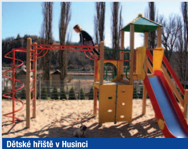
Dětské hřiště v Husinci

komplikované, zvláště když cesty vlakem nejsou často dopředu plánované. Třeba by stačilo na schody k vlaku položit plechové kolejnice pro kočárek. Popřípadě tuto záležitost pořešit v rámci rekonstrukce lávky. Dalším, už závažnějším problémem je nedokončený chodník do horní části Řeže u retardéru. O tomto problému jsme již psali v minulém čísle Naší vesnice. Situace je prozatím ze strany obecního úřadu neřešitelná, třeba