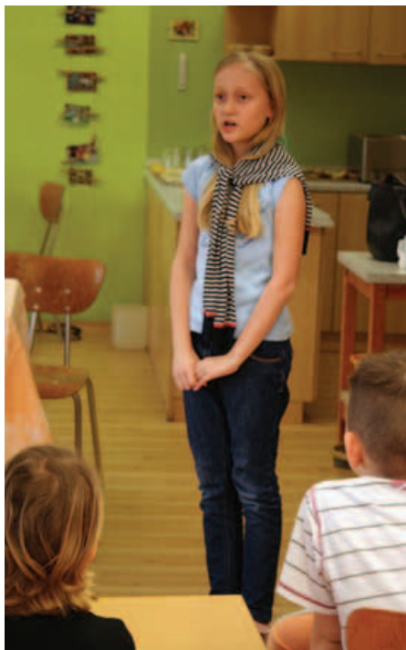
Školní kolo recitační soutěže Pramínek z Řeže

ské školy. Výkony všech byly výborné. Děti překonaly trému a také obecenstvo při jejich přednesu ani nedýchalo. Komise