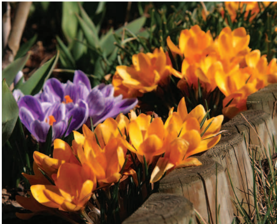
Jaro na řežských zahrádkách