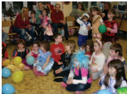
Obecenstvo pozorně poslouchalo...

Nikomu se nechtělo skončit, obléknout se a jít domů, ale jak se říká, v nej-