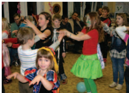
... i nadšeně tančilo