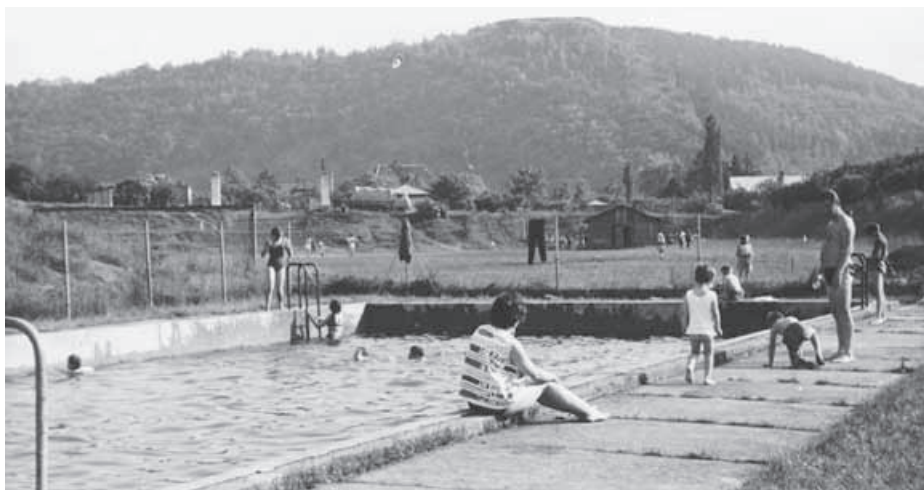
Koupaliště v Řeži (asi 1967)

šená koncem padesátých let. V Husinci byla také hospoda se sálem, ale ta fungovala víceméně jenom jako hospoda, sál se ke kulturním akcím moc nevyužíval. Pouze v šedesátých a sedmdesátých letech, kdy byla hospoda v Řeži zrušená, se tam občas konaly zábavy a jiné akce, ale bylo to v daleko menší míře než v hospodě řežské.