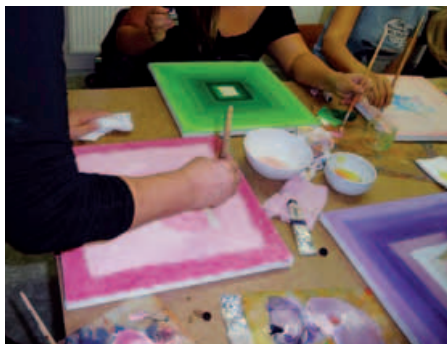
Každý účastník kurzu si namaluje olejovými barvami svůj obraz